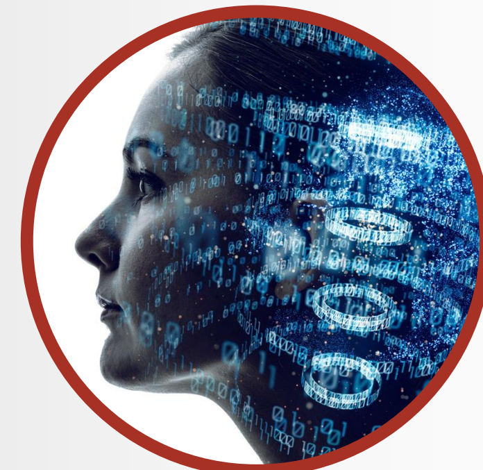
Aumenta exposição internacional