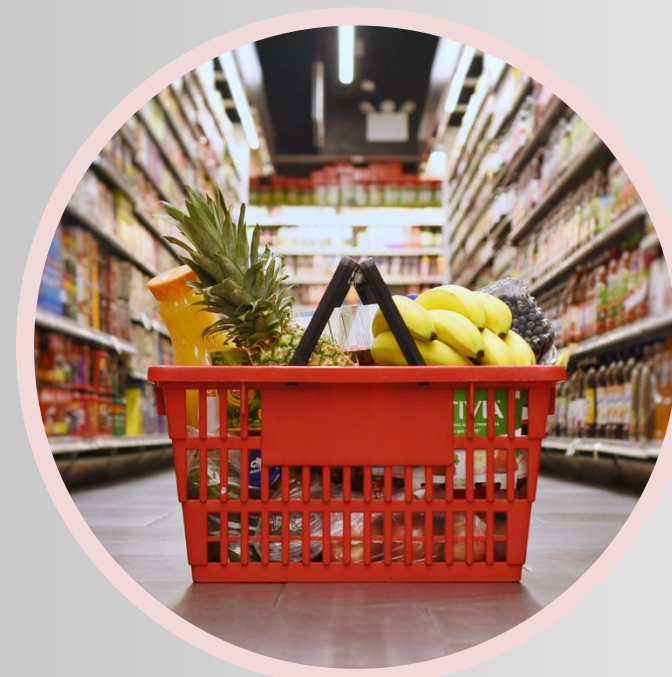
Aumenta arrecadação e riqueza cultural local