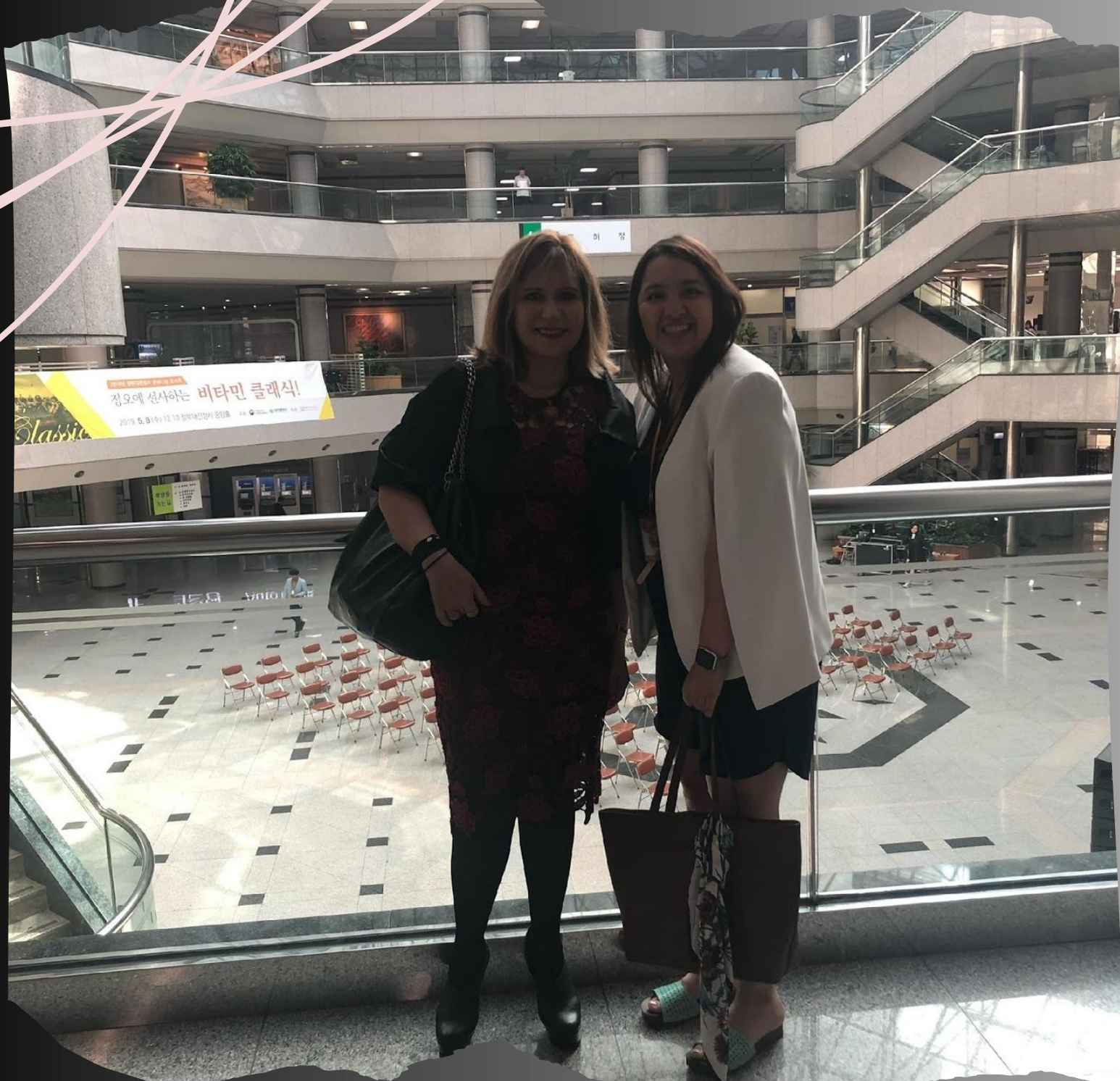
Centro Administrativo em DAJEON

DAJEON: CIDADE COM MAIOR CONCENTRAÇÃO DE DOUTORES DO MUNDO