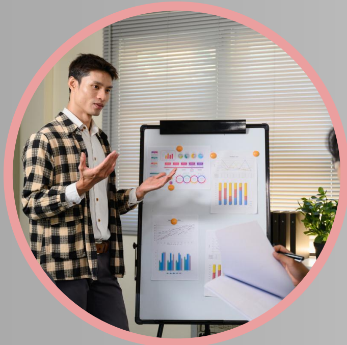
Cria base de P&D