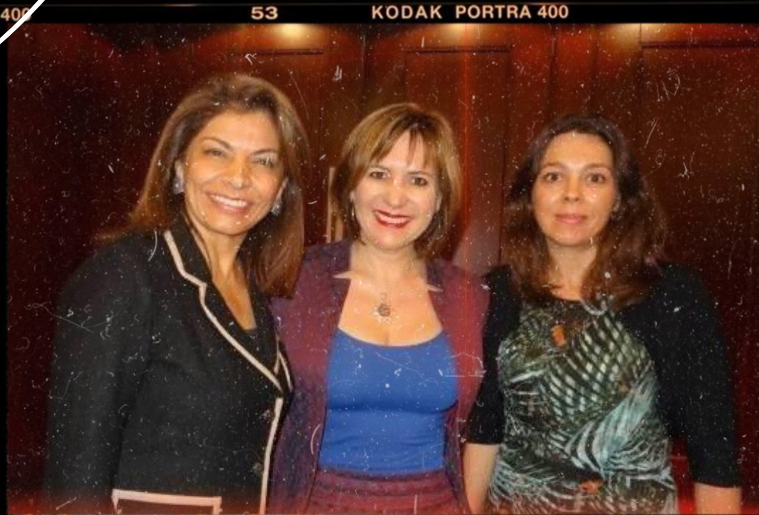
D a Laura Chinchilla, Presidenta de la República de Costa Rica. 5 o Congreso de Innovación y Transparencia