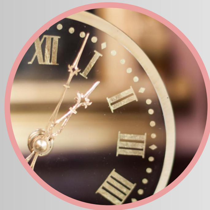
Ganho de tempo