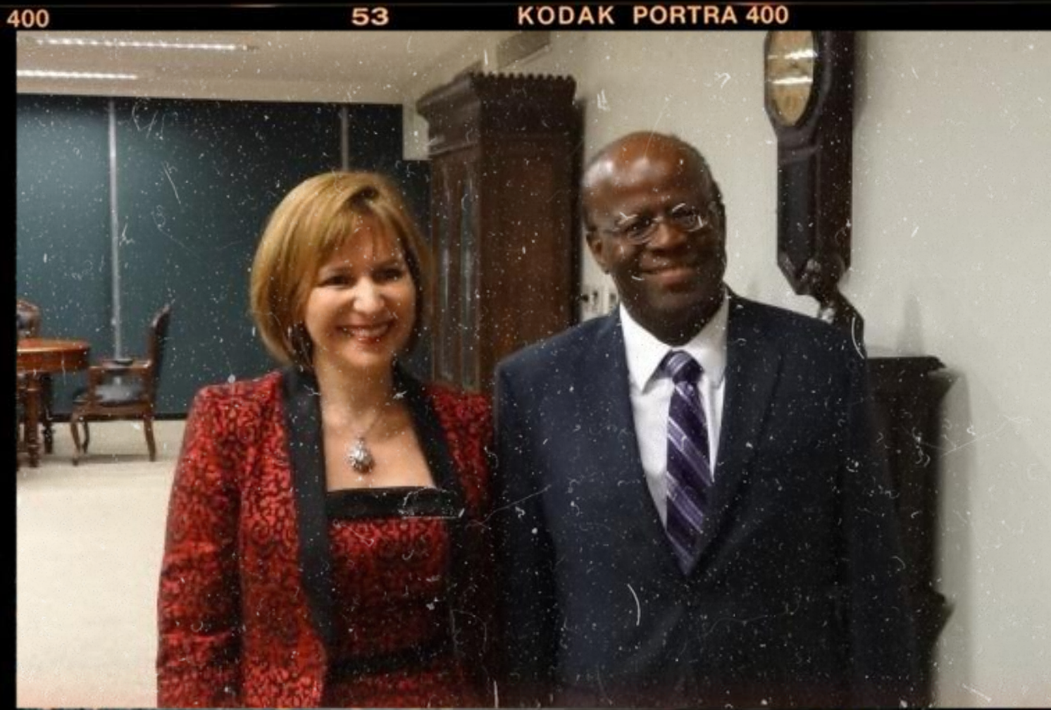
Cooperação Brasil Ecuador Justiça/STF