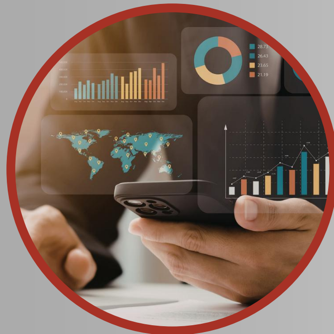
Troca de experiências e troca de soluções prontas