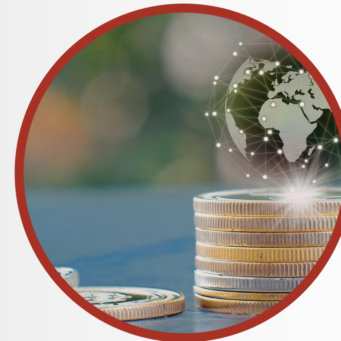
Economia por não reinventar a roda